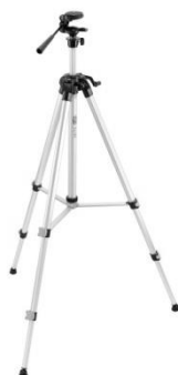
SJJ-M1 EX stativ